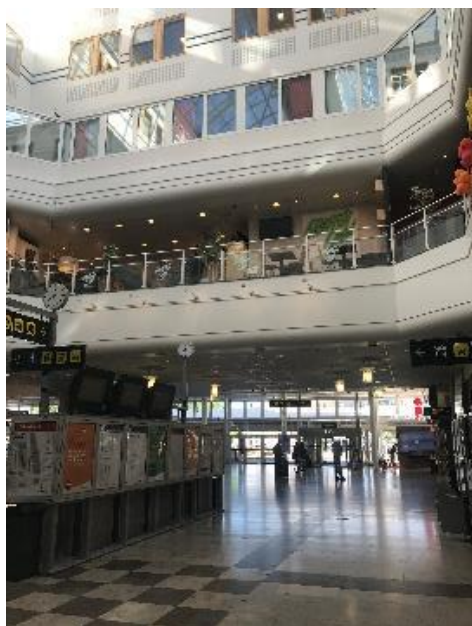
Resecentrum med biljettautomater.