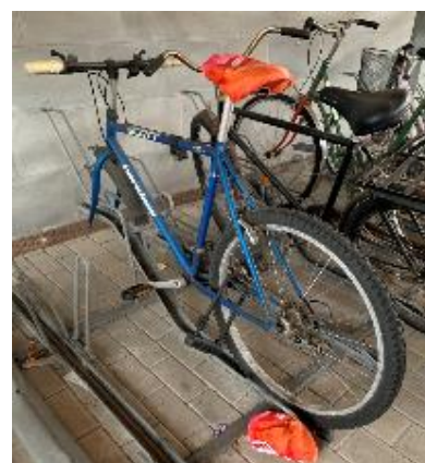
Exempel på cykellik.