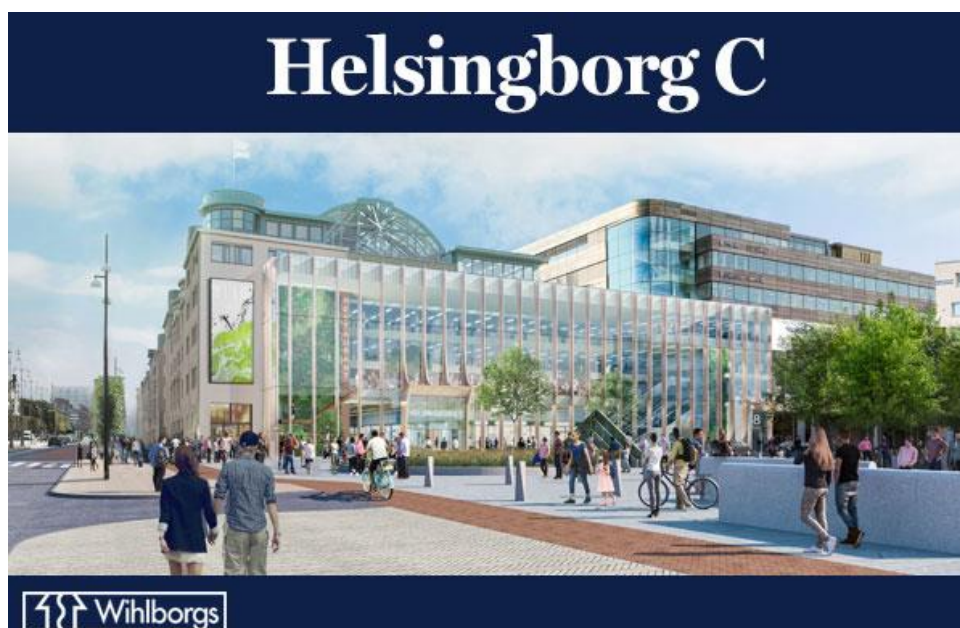
Visionsbild av Helsingborg Central efter ombyggnaden.