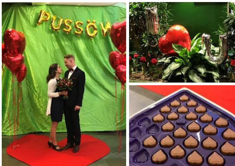
Från invigningen av den uppfräschade Bussön 14 februari 2019.

Vi behöver fortsatt jobba med att analysera jämställdheten i området och se om det finns grupper som känner sig mindre trygga än andra