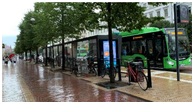
Exempel på parkerade cyklar.