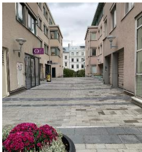
Efter ombyggnad 2020