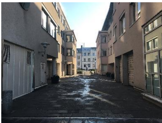
Gattet vid P-däck mot Järnvägsgatan.

Helsingborg Central före certifieringen 2018 till vänster och vid nulägesanalys 2020 till höger.