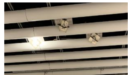
Trasiga eller släckta taklampor.