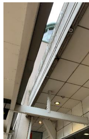
Öppningen i taket vid entrén.