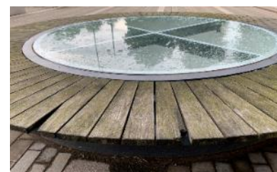
Rund trasig bänk.