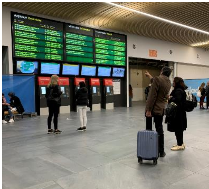
Resecentrum med biljettautomater 2020.