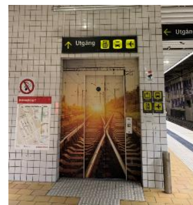
Hissdörrar med järnvägsmotiv.