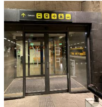
Campus ologiskt skyltat.