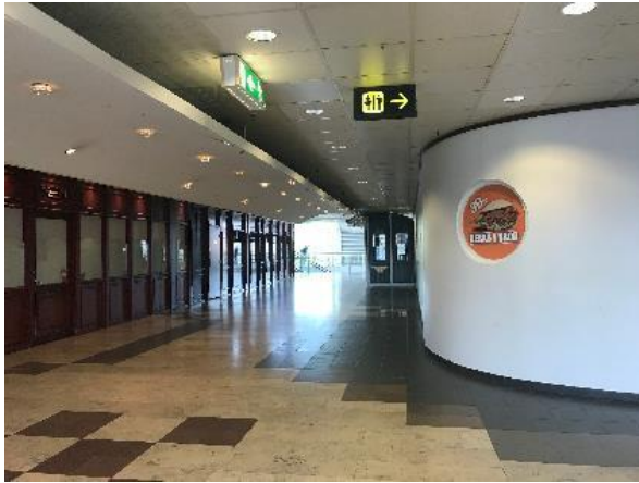
Gången in från P-däck.