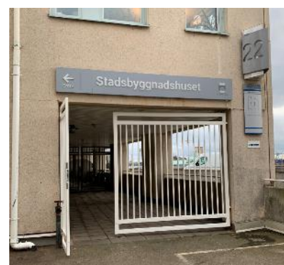
SBF:s grind vid balkongen.