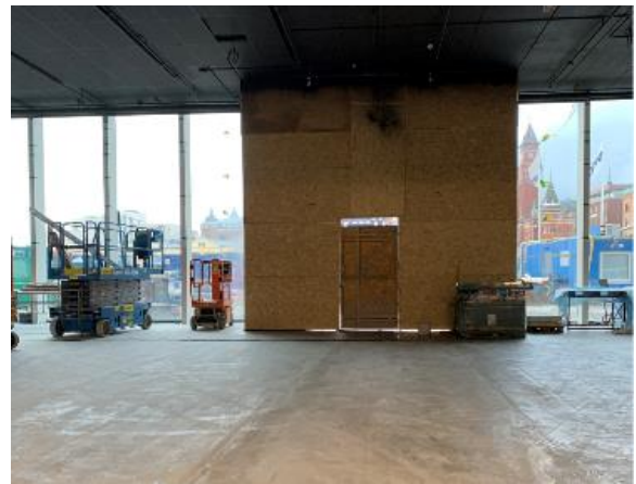
Ny entré inifrån 2020.