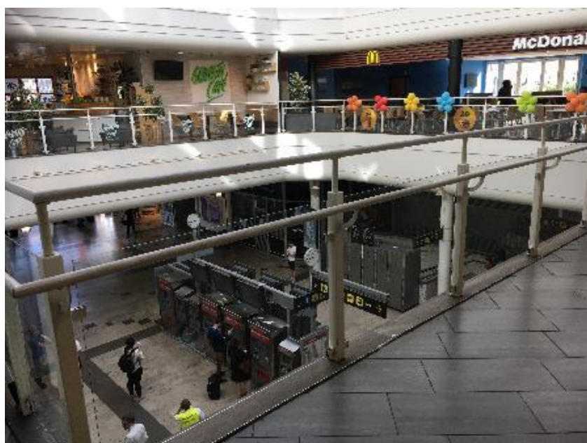
Våning två – ljusschakt ned mot resecentrum.