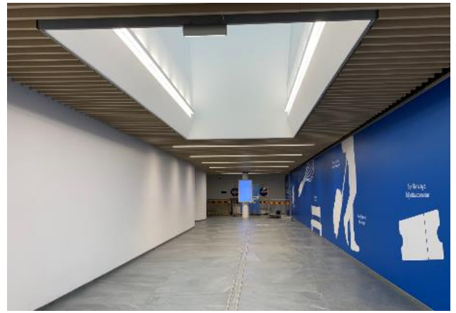
Gången in från P-däck 2020