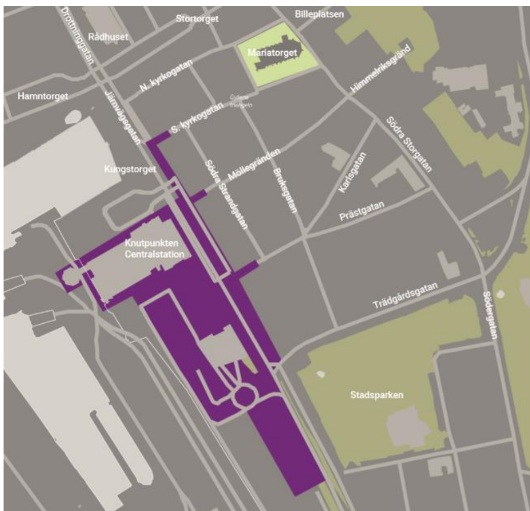
Karta över det aktuella området, Helsingborg Central.

I samband med ombyggnationen har namnet "Knutpunkten", som har förknippats med otrygghet, missbruk med mera, bytts ut till Helsingborg Central, som är tydligare för både besökare och invånare.