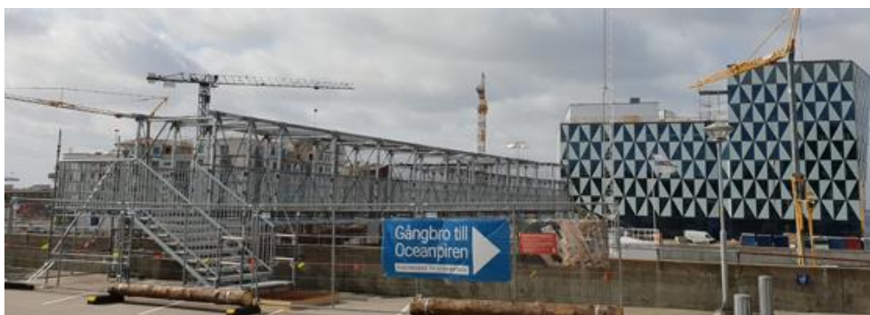
Tillfällig gångbro till Oceanhamnen i avvaktan på permanent lösning.

Trappan från Järnväsgatan upp mot parkeringsdäck byggts om så att den blivit bredare och samtidigt fått en mer inbjudande gestaltning. Trappan är en del av länken mellan den nya stadsdelen Oceanhamnen, som består av bostäder, kontor, hotell och verksamheter i, och Helsingborg Central och stadskärnan. Den andra delen av länken, en gång- och cykelbro över uppmarschområdet till färjorna, har blivit försenad. En provisorisk gångbro har monterats under tiden.